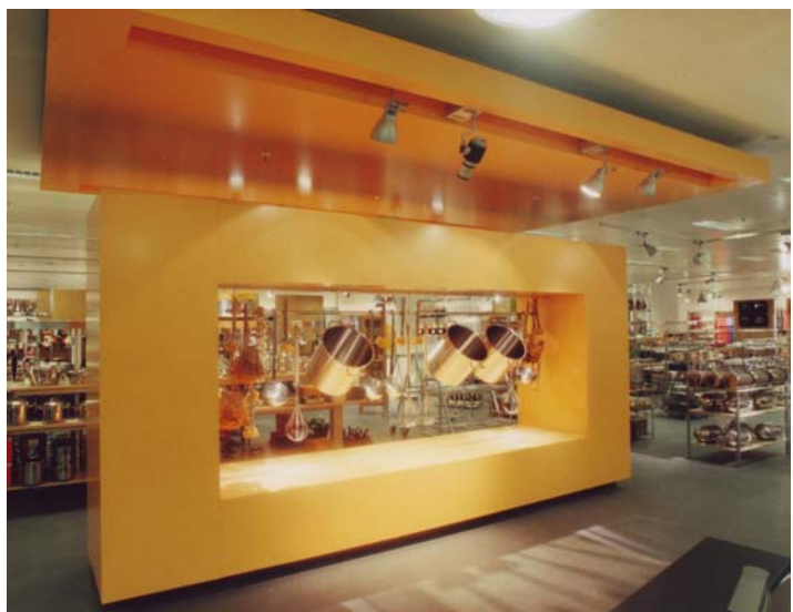
Cook-Shop Ladenbau Living