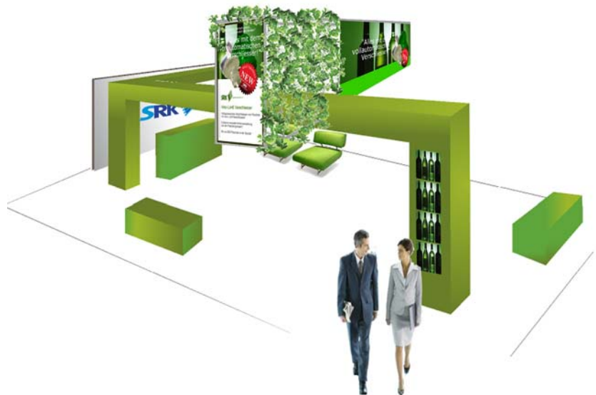
Messestand: „Vino Look Capper“ SRK Systemtechnik