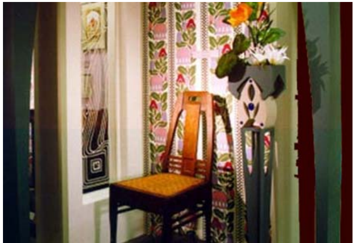
Jugendstilausstellung in Kooperation mit dem Institut Mathildenhöhe Darmstadt