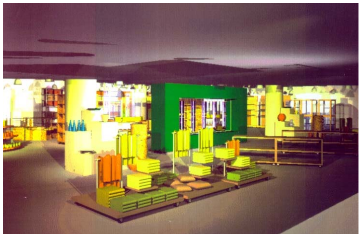
Wellness Bereich Projektskizze Living