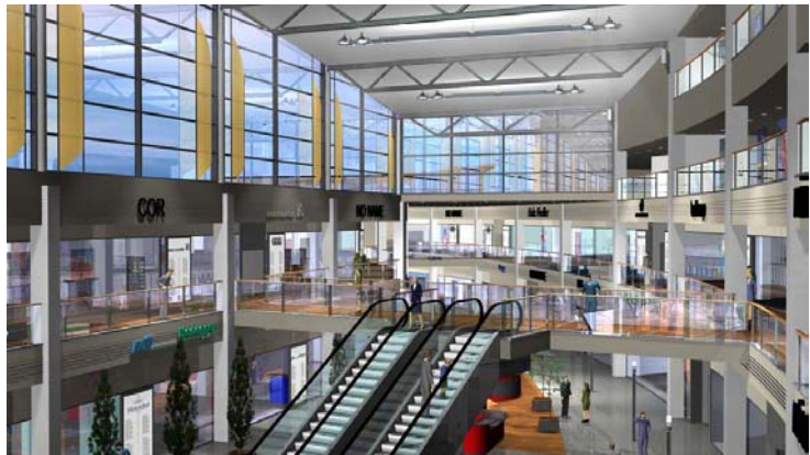
Shopping Mall „Casarena“ Eschborn nicht realisiertes Projekt